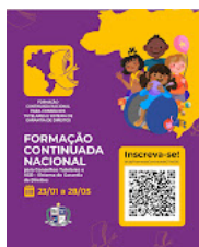
IMG-20240103-WA0045_QR Code para inscrições.jpg 120K