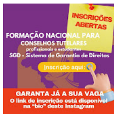
IMG-20240103-WA0046_Card de apresentação.jpg 123K